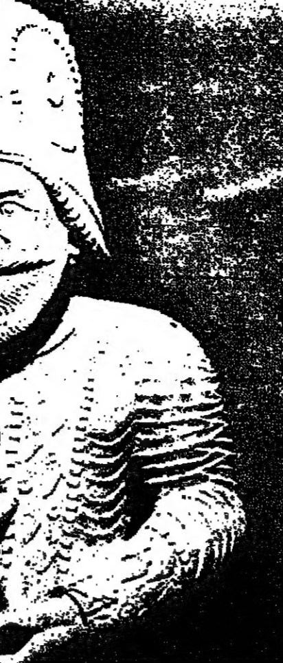
حضارات بلاد ما بين النهرين

صدق العقل ، فالاصيل الاصيل سوف يبقى على المسدى ، لا يزول يستمر الصحيح فعلا صحيحا ما استمرت على الجلاء العقول فصالح القوم يبقى ، جيالا وارتقاء العقول ، شأن جليل ما عهدنا الظلام يعطي بهاء لا ، ولا النور ، ويعزبه الذبول منذ فصح الحياة ، وألحق حق وكذا الخير لم يزول ، والجليل في اكتناه الوجود ، درس يبلغ ان فهمناه ، موتنا يتنحيل نفس درب الحياة ، للموت درب وطريق الصعود ، فيها التزول وحدة الروح شرطنا ، للأصالي ومبادئ الحياة ، فيها الأصول ظننا البني ، أتنا قد قرنا وانتهينا ، ودي قينا الخمول ونهضت يوما غلتنا صروح كان فيها الدوا ، وكان الليل فاتمورا يوكب السخل عرشا ويسل شهب ، يسود فيه الليل وتوارت هوائك الأملز لولا جررة النفس ، والوجود الاصيل فلماذا السرح ، روح شعب عظيم كسل وجدد بقال فيها ، قليل واستعدنا كرامة التبرع وعسا في الليل ، لا يزال السبيل واعندا الرجاء للشعب روحا عبقريا ، عن العنصر لا يبسل فنجلت عناصر الخلق فيها نحن عيون الصواب ، نحن الجليل ما أرنصنا الدعاية حزلا ، ولهورا بيل جنادا ، تقاسمه الفصول وكقول بصوت فيها التمول هكذا نساء طفيل آذار ، فارجل ليهنا الربيل ، وانعمد يا ذلول دبر روح الحياة في الأرض نورا فانشرى الخير ، وأخصبي يا حقول ان بسد الزمان انفاج فكير وافترج ، وما تقبل السهرول وطريق الحياة ، تضبط عقل في حقول الضلال ، راق بصور ومثال الوجود أنسان فمسئل نصره الحزم ، فقهره المستحيل صدق العقل ، فالاصيل الاصيل مستمر ، وخالد ، لا يزول هذا ما نساء روح آذار فارجل انها السبل ، قد اضطل الليل فينادنا مسيرة العز شعوبا مطلق العزم ، فاصل ما يقول عن : صباح الخير - البناء - اللطيفة